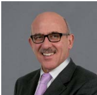
Par Rémy Picard Associé Crowe Horwath Becouze Référent Secteur Non Marchand

“ La raréfaction des ressources impose une grande rigueur de gestion et des outils de pilotage de plus en plus pertinents ”